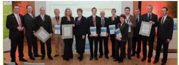
Preisverleihung PROZEUS-UnternehmerPreis 2010

Der UnternehmerPreis bringt den ausgezeichneten Firmen zusätzlichen Gewinn: Große Medienaufmerksamkeit und ein positiver Werbeeffekt sind ihnen sicher.